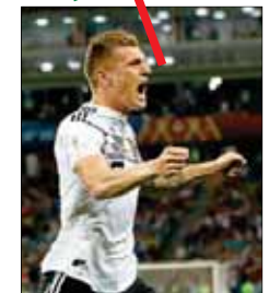
Kroos celebra eufórico el gol de la victoria de Alemania.