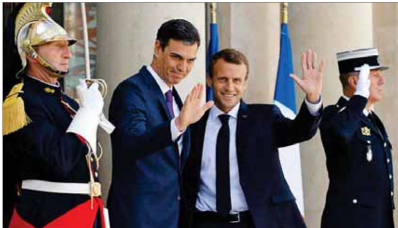
Emmanuel Macron y Pedro Sánchez, ayer, saludando en el palacio del Elíseo de París.