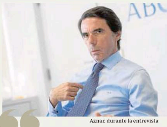
Aznar, durante la entrevista