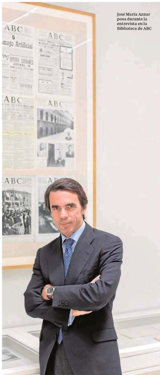
José María Aznar posa durante la entrevista en la Biblioteca de ABC