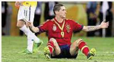
Torres se lamenta ante el árbitro