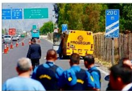
"Ya compadre, hasta acá no más llegamos", le dijeron los asaltantes al chofer, antes de abandonar el camión.

Nuevas medidas incluirán también uso de cámaras HD en camiones y bandas horarias para las operaciones.