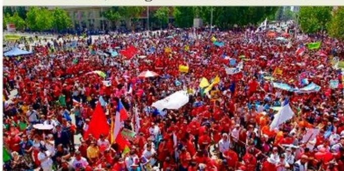
Al menos 10 mil personas, según Carabineros —y entre 30 mil y 40 mil de acuerdo con los organizadores—, se congregaron en el Paseo Bulnes, tras "Marcha por Jesús". Pastores cuestionaron "mal de las leyes que atacan a la familia". C 16