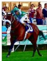
"El Campeón" inicia carrera a la triple corona.

INCIDENTE PROVOCÓ CONGESTIÓN A LA SALIDA DE SANTIAGO | C 10