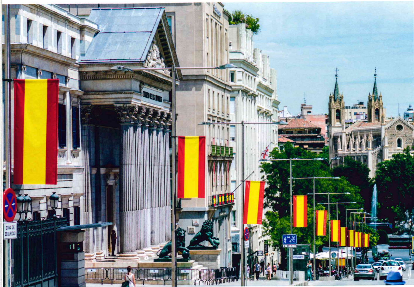
A sede do parlamento Espanhol: segundo Aznar, nada é mais perigoso que o despreparo dos políticos

aquecimento da atividade econômica. A crise política, no entanto, continua. Um exemplo é a ascensão de movimentos nacionalistas separatistas na região da Catalunha e do partido Podemos, um grupo “antissistema” catalisado pela insatisfação espanhola, mas ainda sem um projeto claro de poder. Segundo Aznar, “os dois são igualmente destrutivos