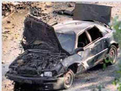
Estado en el que quedó el vehículo en el que viajaba José María Aznar y sus escoltas, así como la calle José Silva de Madrid tras la explosión del coche bomba.

La Casa Real y el entonces presidente del Gobierno, Felipe González, se interesaron telefónicamente por el estado de José María Aznar, quien representaba, en palabras del propio González, «la alternativa real al poder». En 1995 ETA daba por concluido el ciclo político del PSOE y, consciente del futuro acceso del PP al Ejecutivo central, dirigió contra ellos sus armas. El asesinato del líder de