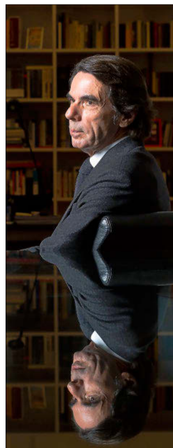
José María Aznar.

¿Merecía la pena embarcarse en ajuste sin garantías? «Yo nunca tuve dudas. Quería acabar con la cantinela de que España era un país que no funciona y llegaba tarde y mal siempre a las citas internacionales». El mismo quemó las naves el 16 de septiembre de 1996 en la Cumbre hispano italiana en Valencia. El entonces primer ministro italiano, Romano Prodi, le propuso evitar el ajuste y que ambos países del sur entraran juntos en una segunda fase. Aznar se negó: «La cumbre de Valencia fue fundamental, ahí fue irreversible que España iba a hacer todo por entrar». A su regreso a Roma, Prodi dio orden de tomar todas las medidas necesarias para cumplir. «Era concebible que Italia, que era socio fundador de la Comunidad Económica Europea, entrara antes que España en el euro, pero no al revés», dice el español. Y bromea que su obstinación fue útil para los italianos: «Desde Berlusconi a otros políticos italianos y todo el norte industrial de Italia me han