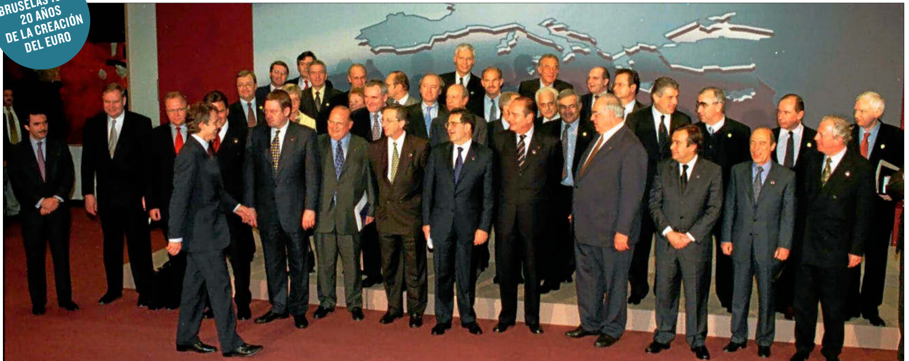
Foto de familia de los jefes de Estado y de Gobierno, y ministros de Finanzas de la Unión Europea que aprobaron el 3 de mayo de 1998 la fundación de la moneda única.

BRUSELAS 1998: 20 AÑOS DE LA CREACIÓN DEL EURO